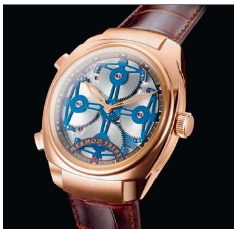
PRIMO 4 La montre-bracelet musicale, alliance du savoir-faire de Reuge et de Mermod Frères.

De fait, Primo 4 contient deux mouvements. Un automatique de base ETA – «nous ne prétendons pas être une